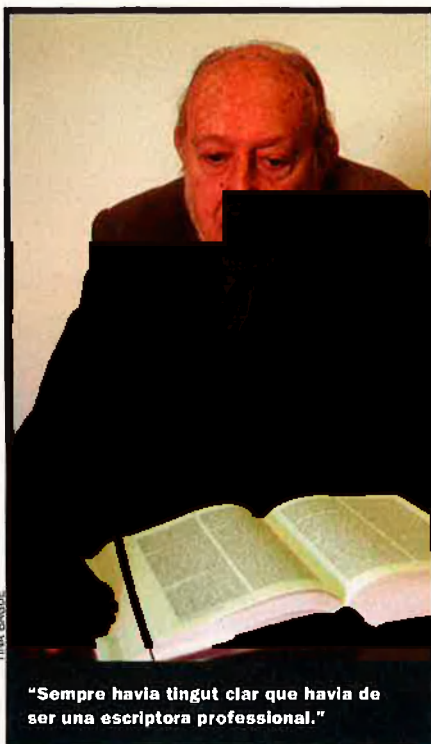
"Sempre havia tingut clar que havia de ser una escriptora professional."

—No era un feminisme excoent ni crispat.