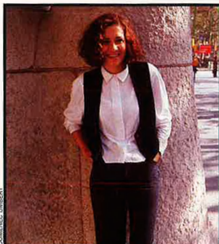
“Ella volia ser actriu i volia ser escriptora, de teatre i de narrativa.”