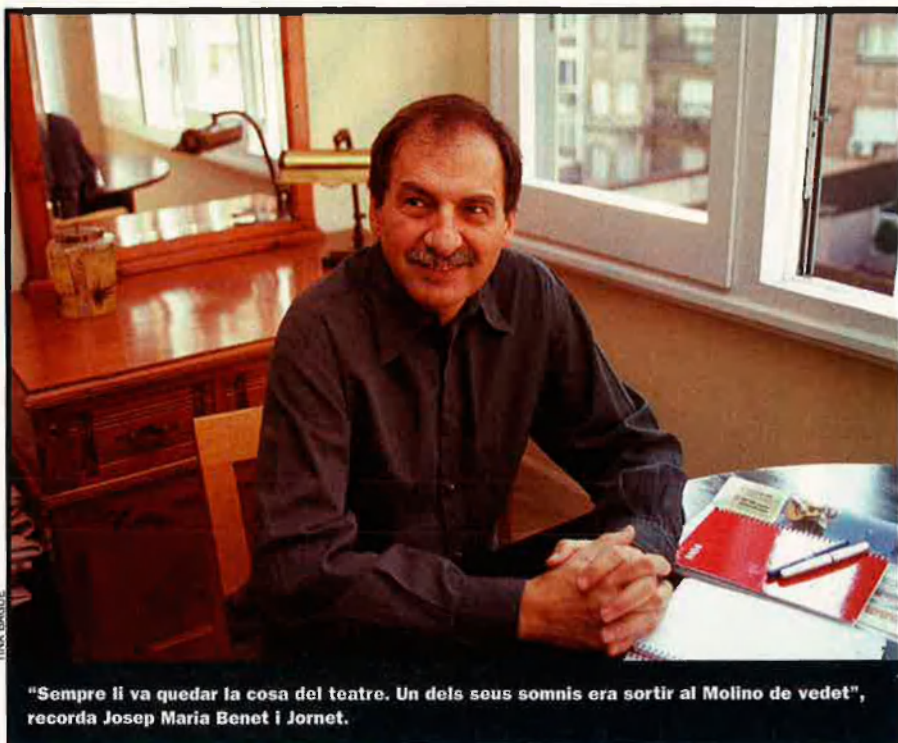
"Sempre li va quedar la cosa del teatre. Un dels seus somnis era sortir al Molino de vedet", recorda Josep Maria Benet i Jornet.

—Amb disset, divuit anys, em va passar unes coses escrites a mà. Li vaig dir, mira, aquesta frase i aquesta, m'han agradat. Es va enfadar una mica, però jo li vaig contestar que amb disset, divuit anys, dues bones frases és