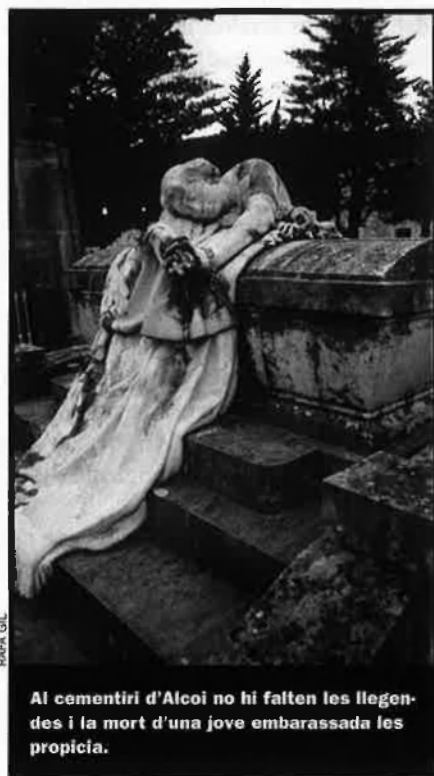
Al cementiri d'Alcoi no hi falten les llegendes i la mort d'una jove embarassada les propicia.

marca el lloc del pintor Ferran Cabrerà (1866-1937), dissenyat per ell mateix, les galeries subterrànies de més de 100 metres de llargària, plenes de fornets o nínxols, o la tomba de l'alcalde que els obrers del paper i el tèxtil, desesperats per l'atur i les dures condicions de treball, varen llançar pel balcó de l'Ajuntament en la vaga del Petroli, el 1873. Però si anem al cementiri d'Alcoi, per força haurem de passar a saludar el cantant i actor Ovidi Montllor (1942-1995). "Porteu-me a Alcoi, que és el meu poble", va deixar escrit en una cançó-testament, i allà és on reposa ara, el temps just de fer vacances i tornar: "Doncs com el mestre/Maragall –continuava la cançó– també crec jo/ en la resurrecció/ de la carn."