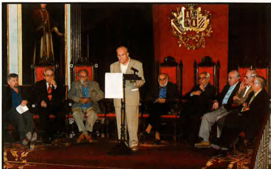
Al paranimf de la Universitat de València, alguns dels autors del "Manifest-testament del segle".