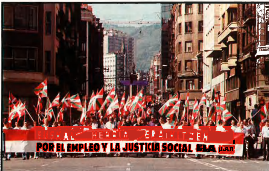
Concentració al País Basc, d'ELA i LAB, l'1 de maig. Com en d'altres nacions sense estat, el pes del moviment sindical és determinant en l'enfortiment dels moviments polítics.

Incapacitat política. El fet és, però, que el nacionalisme català no ha estat capaç d'articular un moviment sindical propi i només ha pogut aconseguir matisar algunes posicions del sindicalisme estatal. Les causes d'aquesta situació són diverses. Tradicionalment s'ha