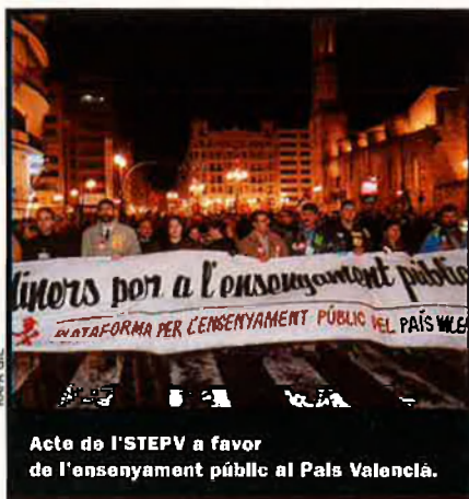
Acte de l'STEPV a favor de l'ensenyament públic al País Valencià.