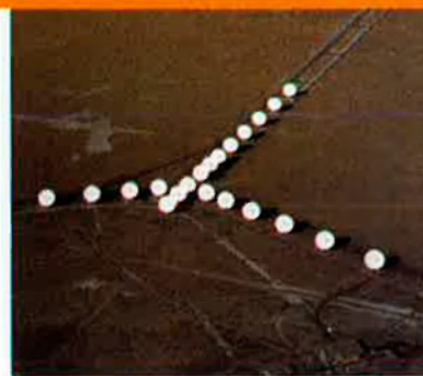
Imatge aèria del radiointerferòmetre VLA. Cadascun dels plats de les antenes fa 25 metres de diàmetre.

Després de més d'un any d'espera, per fi, el setembre del passat any 2000, Cygnus X-3 va experimentar una de les seves grans erupcions. El nostre equip va alertar d'immediat els responsables de l'interferòmetre i les observacions es van iniciar diligentment. D'aquesta manera vàrem obtenir l'ansiada seqüència d'imatges en tres èpoques diferents, amb un interval de dues setmanes entre imatge i imatge (veieu la figura adjunta). En efecte s'hi veu com Cygnus X-3 ejecta dolls o jets de plasma en direccions oposades al 50% de la velocitat de la llum. La asimetria entre els dolls oposats és deguda a efectes relativistes que discutim en detall a l'article de la revista especialitzada Astronomy & Astrophysics , de la qual la imatge n'ha estat la portada el passat mes d'agost. En la darrera època d'observació, els dolls de plasma s'estenen sobre una mesura comparable a 100 vegades la del Sistema Solar, la qual cosa és un factor 10 més gran del que s'esperava trobar. Aquesta mena de resultats permetrà sens dubte comprendre millor alguns dels fenòmens més energètics de l'univers a la vegada que no deixen de bocabadar els científics.