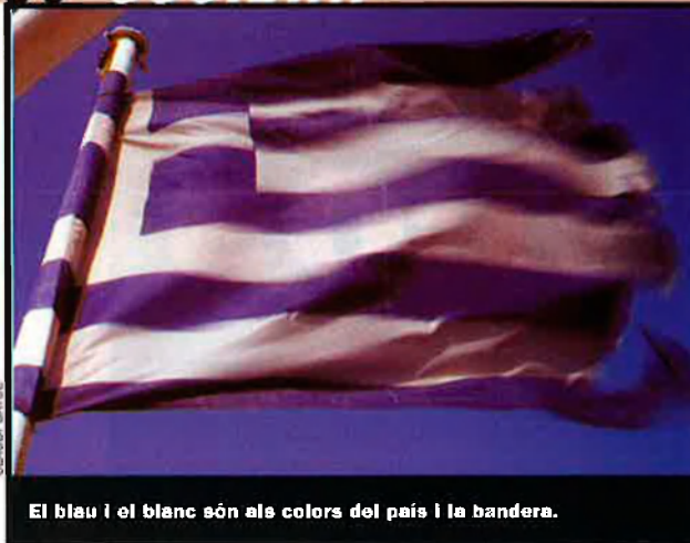
El blau i el blanc són als colors del país i la bandera.

Hom diria que aquesta terra daurada i senyorial pesa tant que redueix l'arquitectura a pura terrissa. Vegem-ne les esglésies amb les successives capes de