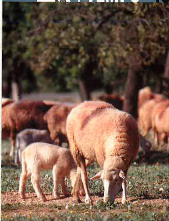
PRATS I CAMPS

Ovelles típiques mallorquines. Tot i tractar-se d'una ramaderia amb escassa presència de produccions intensives, el Govern balear vol, a través de diverses marques de qualitat, potenciar les races autòctones com aquesta. Precisament, la cabanya ovina és la més important de les Illes.