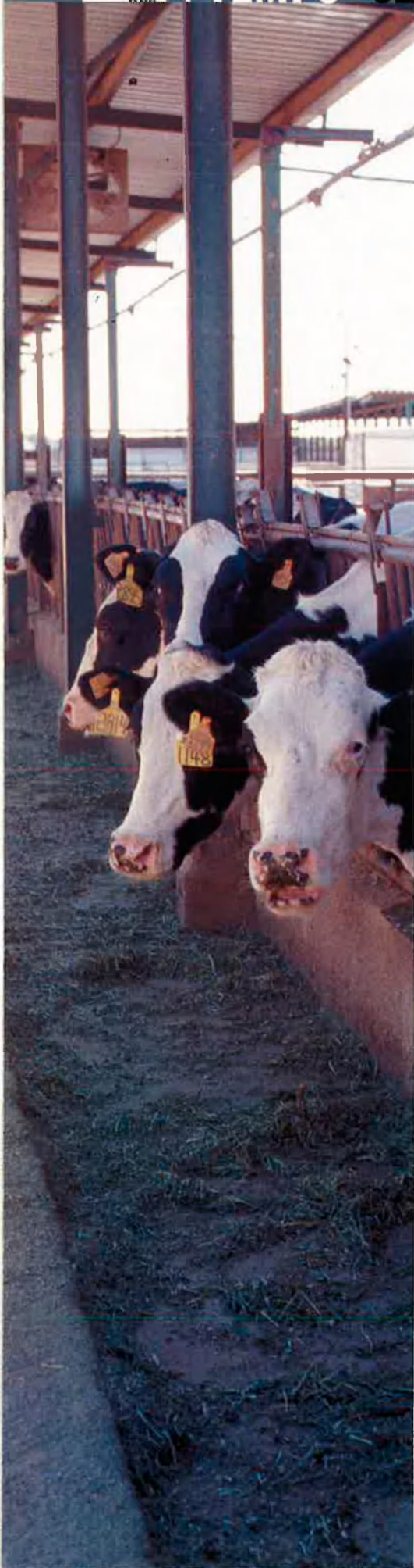
F. RATIS I CAMPS

amb abundància de prats aptes per al cultiu de farratge i per a la pastura, ha determinat que aquest petit país de 468 quilòmetres quadrats tingués històricament una gran tradició ramadera, especialment en ovins i bovins, tant pel que fa a la pròpia cabanya com als ramats de transhumància estacional procedents de les terres baixes dels països veïns. Aquesta tradició però, va començar a decaure a mitjan segle XX, en diversificar-se l'economia andorrana a favor del boom en els sectors comercial i turístic, i augmentar consegüentment el preu del terreny i la dedicació d'una gran part d'aquest a l'especulació urbanística.