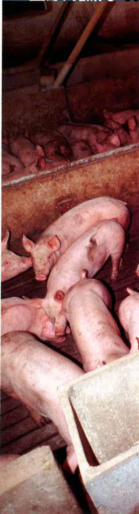
FRATS I CAMPS

que han hagut de ser sacrificades per eradicar la pesta porcina. Al País Valencià, davant la dificultat que una bona part dels ramaders a títol individual pogueren entrar en un sistema d'aquest tipus, Brusca aposta per potenciar nuclis o zones molt concretes, com per exemple la comarca dels Serrans –amb una elevada densitat de producció porcina–, com a nuclis ramaders de cicle tancat, que es dediquessin a produir garrins suficients per poder abastir-se.