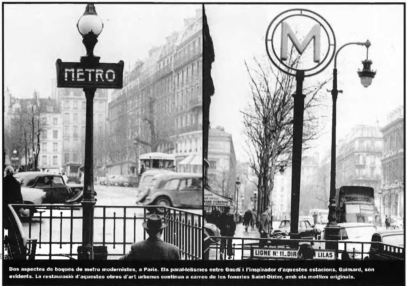
Dos aspectes de boques de metro modernistes, a París. Els paral·lelismes entre Gaudí i l'inspirador d'aquestes estacions, Guimard, són evidents. La restauració d'aquestes obres d'art urbanes continua a càrrec de les fonderies Saint-Dizier, amb els motllos originals.

lles Arts. Els crítics francesos reben els seus treballs amb condescendència; tot plegat, no gaire lluny de l'ambient barceloní. El creador de la Pedrera no menciona mai en els seus escrits Guimard, el creador de les conegudes boques de metro modernistes de París. Guimard sembla que tampoc en diu res, de Gaudí, en els seus escrits. Els paral·lelismes entre els dos artistes, però, són evidents. L'art total, des de la façana fins al mobiliari de la casa, la fascinació per les formes orgàniques, la recerca de noves vies d'expressió. Val a dir que Gaudí és modernista, però sobretot, és fidel a... Ell mateix.