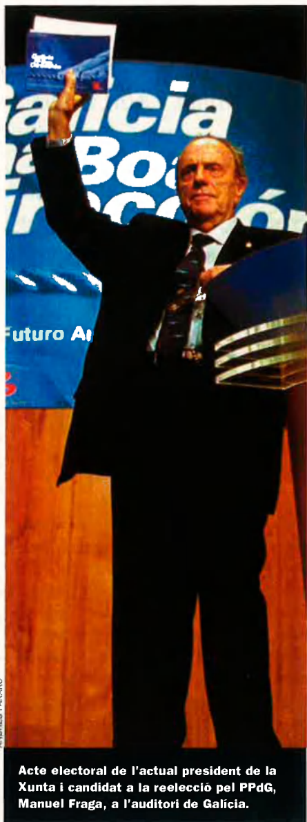
Acte electoral de l'actual president de la Xunta i candidat a la reelecció pel PPdG, Manuel Fraga, a l'auditori de Galícia.