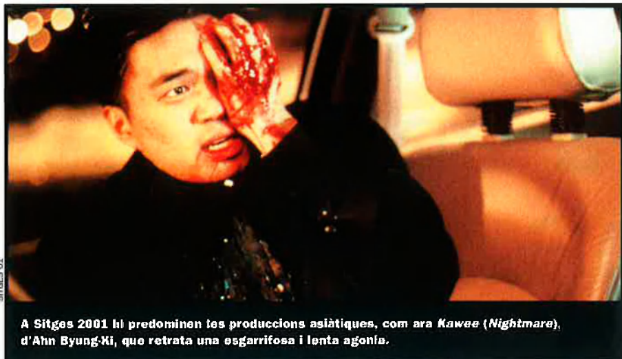
A Sitges 2001 hi predominen les produccions asiàtiques, com ara Kawee ( Nightmare ), d'Ahn Byung-Ki, que retrata una esgarrifosa i lenta agonia.

germànic. D'altra banda, una de les apostes més radicals de l'omnipresent Kim Ki-Du es deixa veure a Address unknown , un film que a la Mostra de Venècia ha generat polèmica: alguns l'han considerada obra mestra i altres l'han titllat de tremendista.