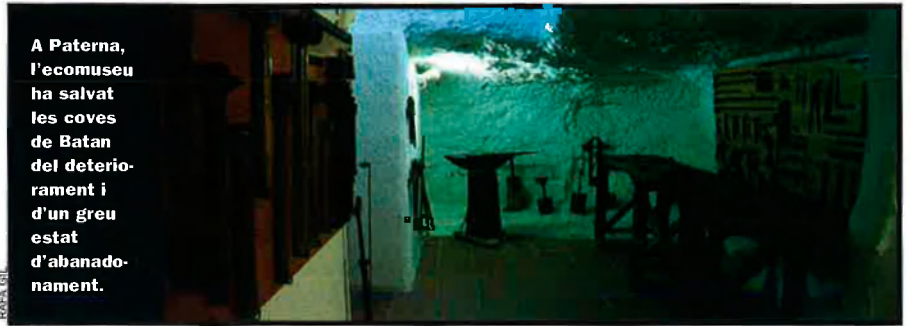
A Paterna, l'ecomuseu ha salvat les coves de Batan del deteriorament i d'un greu estat d'abandonament.

No obstant això, alguns projectes d'ecomuseu no han tingut gaire èxit perquè no han sabut copsar la dinàmica de canvis constants, que precisament un ecomuseu ha de reflectir. "L'error d'alguns ecomuseus ha estat a l'hora de crear satèl·lits relacionats amb la seu central: han optat sempre per activitats en desús, cosa que dona al visitant la impressió d'aturada en el temps. L'ecomuseu ha de ser un element dinàmic capaç de recuperar el passat, treballar en el present i tenir visió de futur", explica Josep Manuel Rueda, director del Museu Etnològic del Montseny. Aquest museu és un exemple de dinamisme, ja que ha creat un seguit d'itineraris que mostren la realitat actual i que són el complement de la visita al museu per mitjà dels quals es proporciona una visió completa de l'evolució de les formes de vida en un entorn concret, mostren activitats tan actuals com les carrosseries, les embotelladores o l'ex-