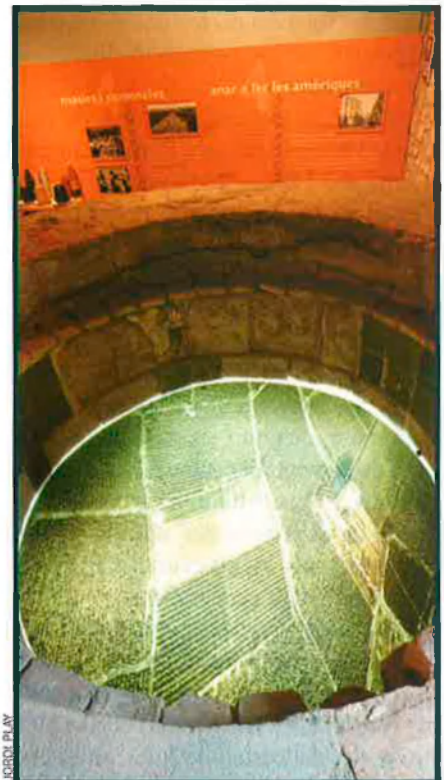
El castell de Rubí conserva el patrimoni i la cultura tradicional i popular de la ciutat.

Una mostra de l'equilibri entre la conservació i l'explotació l'ofereix l'Ecomuseu del Parc Natural del Delta de l'Ebre, inaugurat l'octubre del 1989. En un recinte a l'aire lliure de dimensions reduïdes es reproduïx la totalitat d'ambients d'aigua dolça naturals (bassa, riu, illa fluvial, bosc de ribera), i els modificats per l'home (arrossars, horta, pesca, barraques, llagut). Hi destaca també l'aquari, que acull en viu les principals espècies del Delta i l'autèntic llaüt recu-