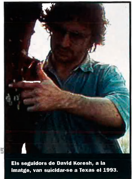
Els seguidors de David Koresh, a la imatge, van suïcidar-se a Texas el 1993.

El monarca universal de les profecies havia de ser ajudat per un papa en la seua lluita contra el mal. Però el problema és que altres profecies diuen que l'Anticrist serà un papa. En realitat, l'últim papa. Segons l'escriptor i enigmista Màrius Serra, "una profecia atribuïda a sant Malaquies, bisbe irlandès del segle XII, parla d'un seguit de papes. Surt un lema en