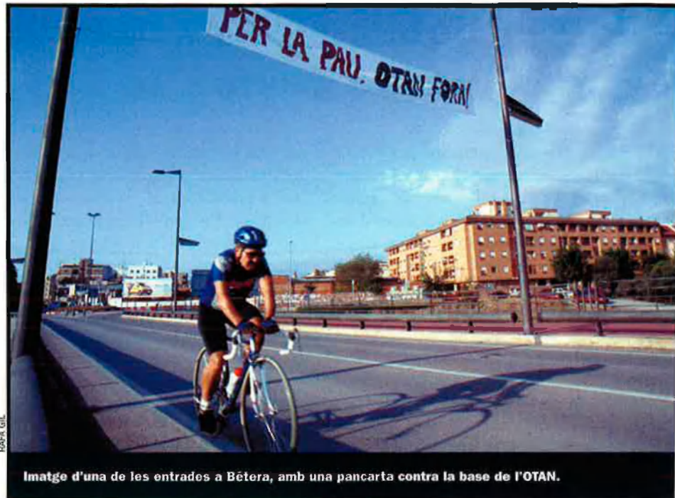
Imatge d'una de les entrades a Bétera, amb una pancarta contra la base de l'OTAN.

El Govern espanyol vol convertir la base militar que hi ha a la rodalia de la cartoixa de Portaceli, a Bétera (Camp de Túria), en un quarter d'intervenció ràpida de l'OTAN. Una iniciativa rebutjada per l'Ajuntament d'aquest poble i per una plataforma ciutadana.