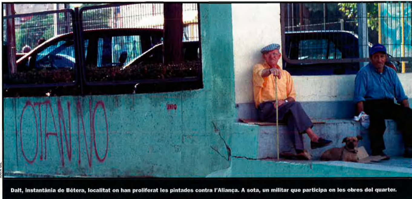
Dalt, instantània de Bétera, localitat on han proliferat les pintades contra l'Aliança. A sota, un militar que participa en les obres del quarter.