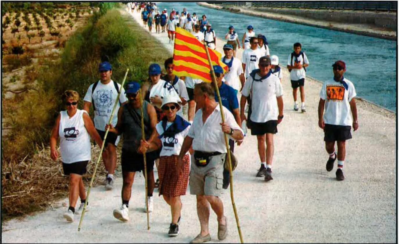
Inici de la "Marxa Blava" a Amposta, aquest agost. Les mobilitzacions contra el PH estatal han arribat fins a Brussel·les.

l'alcaldia de Montblanc. Les eleccions municipals de l'any 1991, una coalició de forces d'esquerra aconseguí l'alcaldia del municipi amb el lideratge d'Andreu Maiaio, un dels alcaldes més emblemàtics provinents del moviment d'oposició al pla de residus.