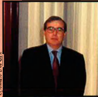
AL. SHAMEN/DAVI. G.S.

—Tenim molta implantació territorial. És evident que és més fàcil dir "Transvasament, no" que no pas explicar el Pla Integral de Protecció del Delta de l'Ebre, que hem regulat els cabals hidrològics, que les hidroelèctriques no tinguin la clau de regulació del riu, etc. Per tant, hem de fer un esforç per explicar tot això... Tot i que el sentiment de la gent del territori s'oposa a la detracció d'aigua. Això és evident, però nosaltres hem fet un acte de responsabilitat que hauríem pogut evitar, però l'hem fet perquè enteníem que era l'única manera de millorar aquest PH. És més, si altres forces