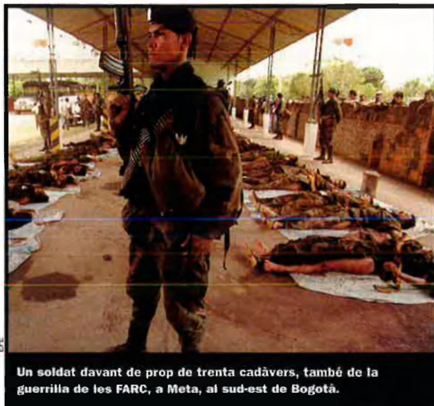
Un soldat davant de prop de trenta cadàvers, també de la guerrilla de les FARC, a Meta, al sud-est de Bogotà.