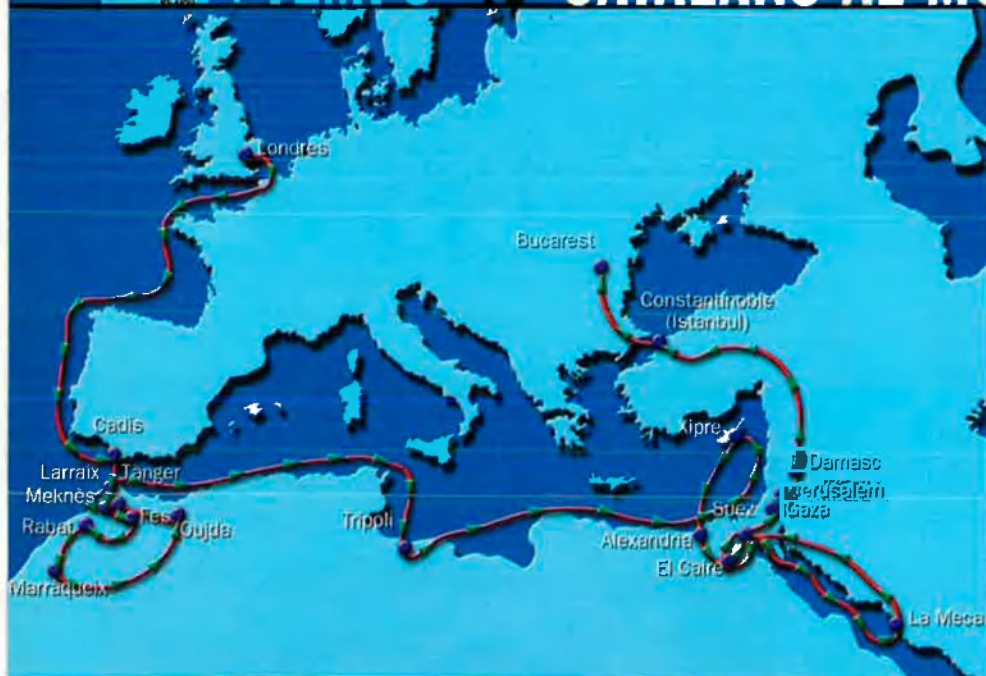
La travessia feta per Ali Bei impressiona: està plena d'aventures, però també envoltada de molts misteris. La Meca va calar especialment en el singular viatger i espia català.

tats per passar a la pràctica i construir-ne un. L'autorització li va ser concedida però el globus mai no arribà a enlairar-se. Temps després, quan ja era casat, tenia una filla i s'havia instal·lat a Madrid, publicà una traducció al castellà dels quatre volums dels Assaigs sobre la higrometria d'Horace de Saussure. Aquestes publicacions i les seues dèries d'imitar Montgolfier demostren que Badia havia assumit totalment el rol d'home curiós, àvid de saber teòric, i a la vegada, d'home d'acció, capaç de dur a la pràctica els seus coneixements. Un model que els philosophes francesos i, especialment, els treballs de l' Enciclopèdia havien transmès a tot Europa.