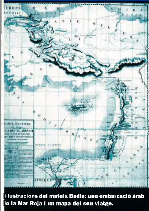
Il·lustracions del mateix Badia: una embarcació àrab a la Mar Roja i un mapa del seu viatge.