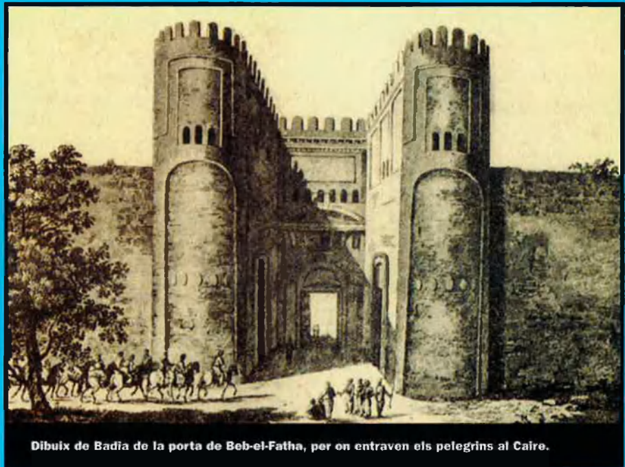
Dibuix de Badia de la porta de Bab-el-Fatha, per on entraven els pelegrins al Caire.

La preparació científica de Badia li va permetre realitzar uns mapes magnífics del país que va visitar, sens dubte els millors amb què es podia comptar en l'època. També, gràcies als seus coneixements d'astronomia, va poder preveure dos eclipsis, un de lluna i un altre de sol que es van esdevenir quasi seguits. En anunciar-los, es va guanyar l'enemistat d'alguns savis que pul·lulaven per la cort i a qui el soldà va acusar de no saber tant com Alí Bei; i va aconseguir també una certa fama de nigromàntic que ja no l'abandonaria mai. El dia de l'eclipsi de sol, malgrat els seus intents de donar una explicació raonable i científica, la ciutat de Fes, on es trobava, va caure víctima del caos: "Els habitants corrien pels carrers fent grans crits com a bojos; els terrats estaven plens de gent i ma casa tan atapeïda que era impossible fer un passeig des de la porta fins a dalt." Una vegada va passar, les gentes de la ciutat li