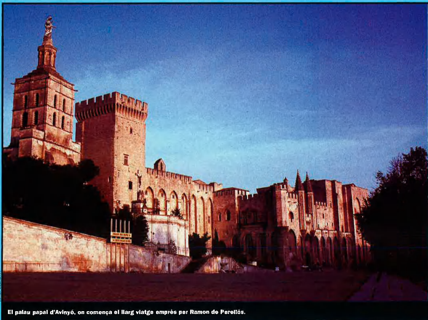
El palau papal d'Avinyó, on comença el llarg viatge emprés per Ramon de Perellós.

rellós i el seu grup fins a París. A la capital francesa, el vescomte es va entrevistar amb el rei Carles VI i va obtenir d'aquest i dels ducs de Berry i de Borgonya, cartes de presentació i recomanació per al rei d'Anglaterra, Ricard II, gendre del monarca francès. Des de París, els viatgers van anar a Calais, per embarcar-se cap a Anglaterra, on van arribar el dia de Tots Sants. En la seua primera etapa anglesa el grup es va dirigir a Sant Tomàs de Cantorbery i després cap a Londres. A la capital, van descobrir que el rei s'havia desplaçat a un parc pròxim a Oxford on havia muntat unes magnífiques tendes per passar un temps. El rei d'Anglaterra va rebre magníficament el vescomte de Perellós i li va donar un salconduit que encara avui es conserva i que, en llatí, autoritza el nostre cavaller a recórrer les possessions del rei anglès (entre les quals, almenys nominalment es trobava Irlanda) i a entrar i eixir del Purgatori. El