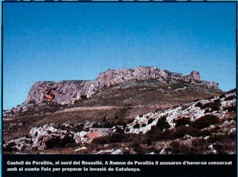
Castell de Perellós, al nord del Rosselló. A Ramon de Perellós li acusaren d'haver-se conxorxat amb el comte Foix per preparar la invasió de Catalunya.

El vescomte Ramon de Perellós i de Roda és el protagonista màxim d'aquest viatge a Irlanda, realitzat al segle XIV amb una intenció ben curiosa: entrar al purgatori i visitar el difunt rei Joan I.