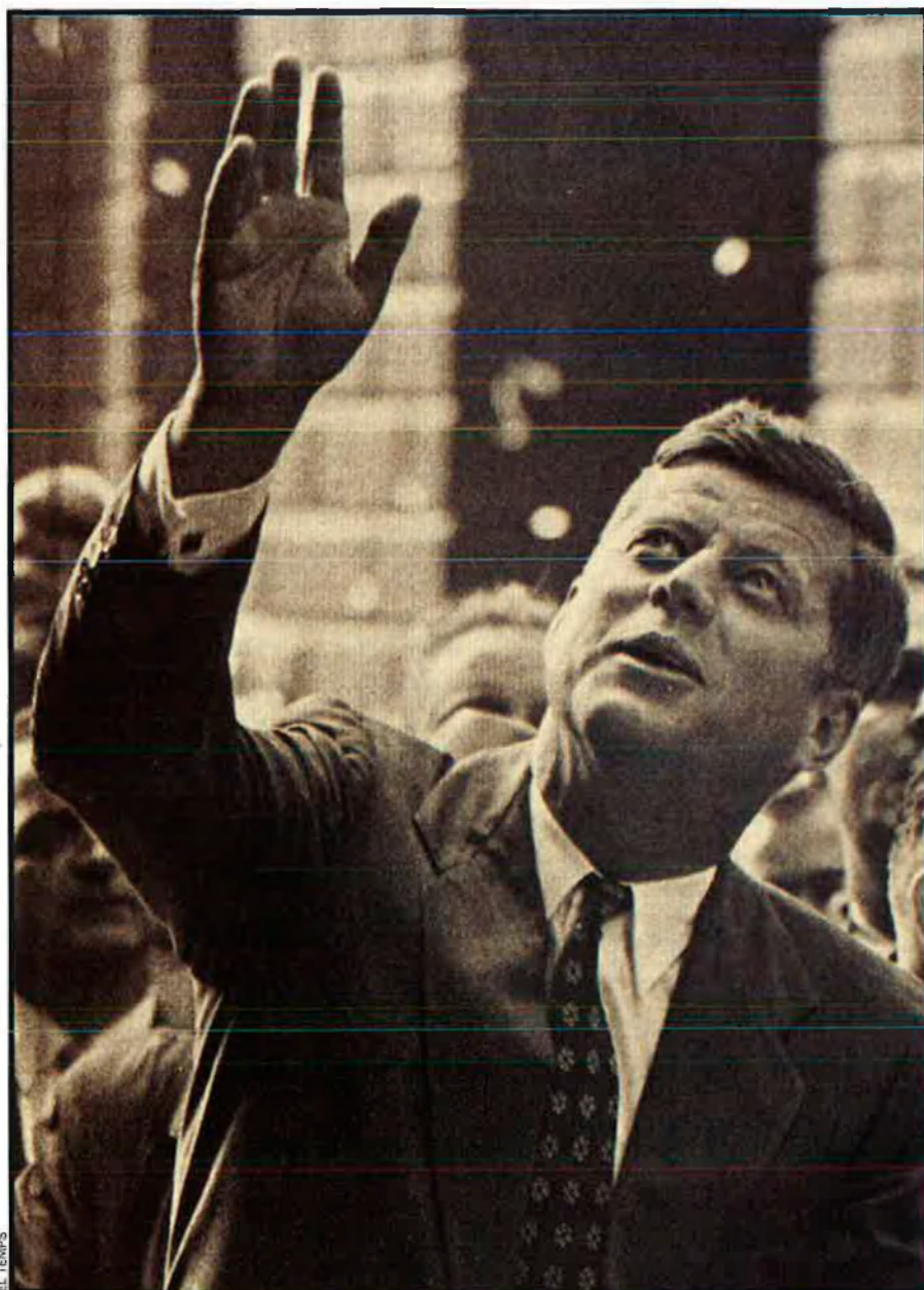
La Biblioteca John F. Kennedy de Boston es manté tancada. Allà podria haver-hi les claus de l'Operació Mangosta, així com les de les relacions de Kennedy -en la foto- amb la màfia.