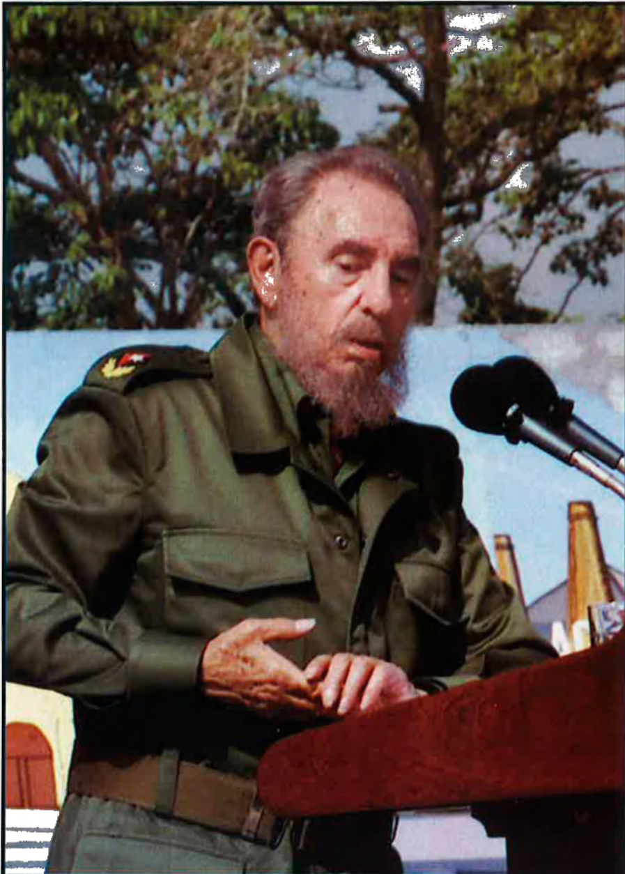
Castro, situat en el punt de mira de la CIA, va seduir amb el seu carisma la vídua de Hemingway, la qual es va negar a col·laborar en l'eliminació del líder cubà.

Encara que en el document no es pot llegir en cap dels paràgrafs la paraula "assassinar", es pot interpretar que els Kennedy van donar llum verd a la liquidació de Fidel Castro