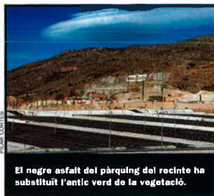
El negre asfalt del pàrquing del recinte ha substituït l'antlc verd de la vegetació.

El contenciós s'enceta en les vies pecuàries. Ecologistes en Acció va impugnar el pla especial director d'u-