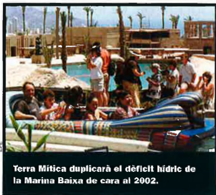
Terra Mítica duplicarà el dèficit hídric de la Marina Baixa de cara al 2002.