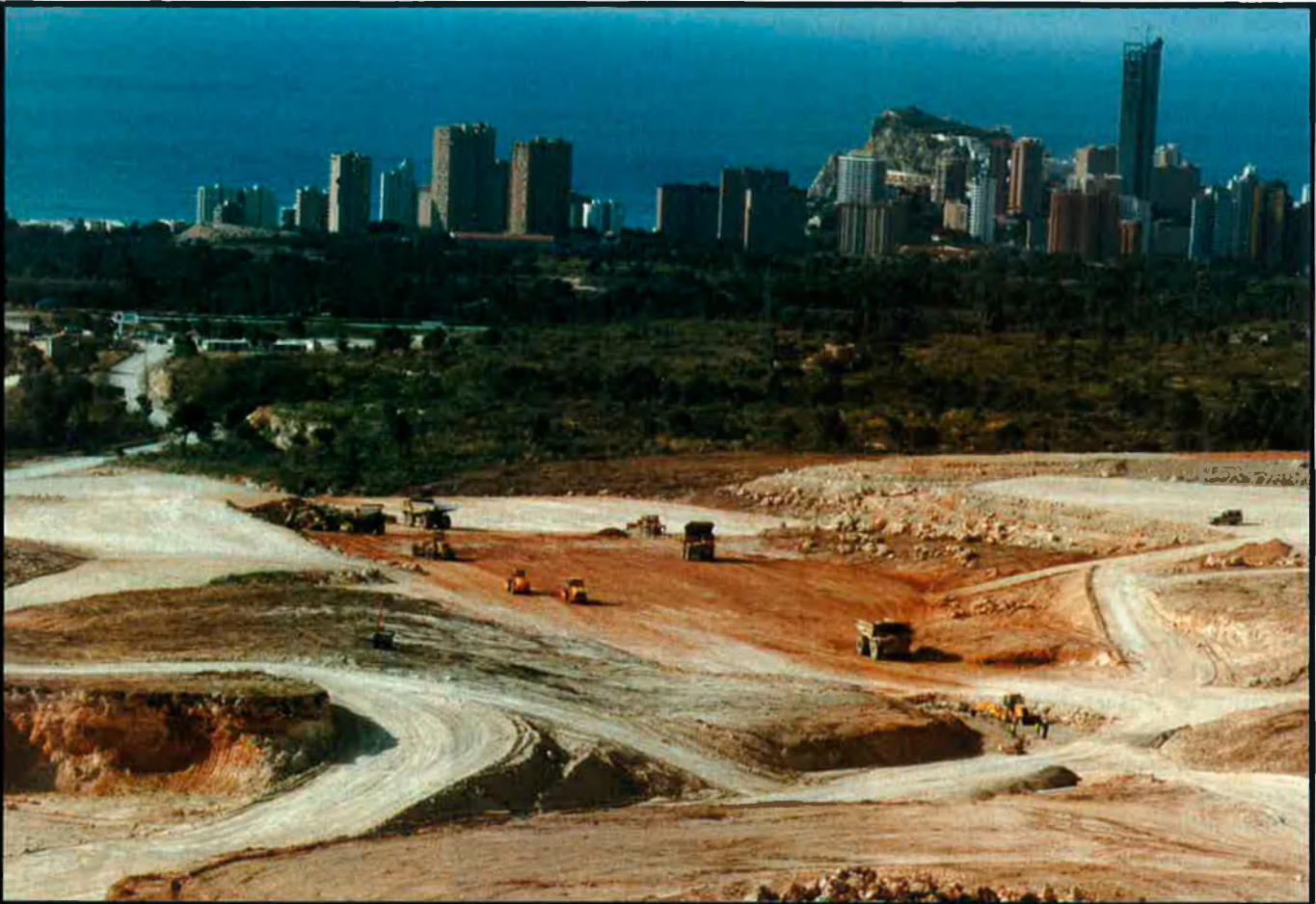
Obres de construcció del complex benidormer, elevat sobre uns terrenys cremats l'estiu de l'any 1992. Al fons, la cala Finestrat.

1992 es va calar foc –“intencionadament”, diuen– a la pinada de la serra Cortina, entre les poblacions de Finestrat i Benidorm. Aleshores, l'actual president de la Generalitat Valenciana, Eduardo Zaplana, era l'alcalde de la capital de la comarca i “pregonava que faria tot el possible perquè no es perdera cap metre quadrat més d'aquest indret