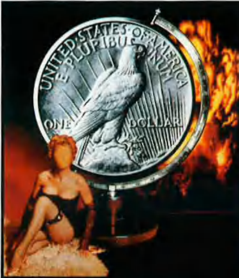
Sobre aquestes línies, obra de Renau de la sèrie The American Way of Life , escenifica la malaltia del capitalisme, que és allò que ha acabat amb el seu mural.