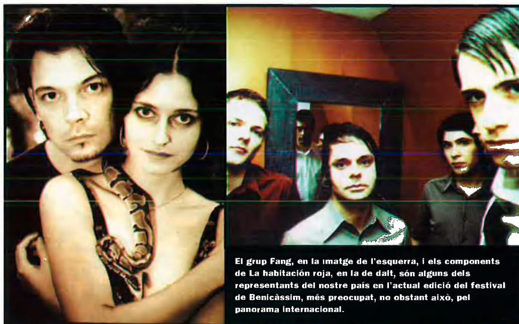
El grup Fang, en la imatge de l'esquerra, i els components de La Habitación Roja, en la de dalt, són alguns dels representants del nostre país en l'actual edició del festival de Benicàssim, més preocupat, no obstant això, pel panorama internacional.