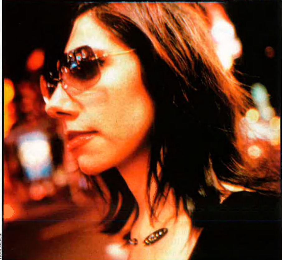
Dalt, Basement Jaxx, que arrasaran el festival amb el seu house de combat. Davall, PJ Harvey, la deessa de la melangia i el dolor del cor. Aquests artistes ja han passat pel FIB, però ara tornen per repetir un èxit que pot consolidar-se. El públic del FIB ho haurà de decidir.