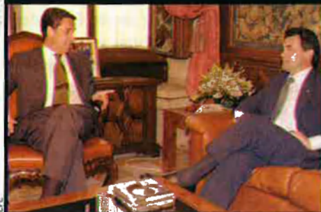
Zaplana i Artur Mas van apropar posicions el dilluns de la setmana passada.