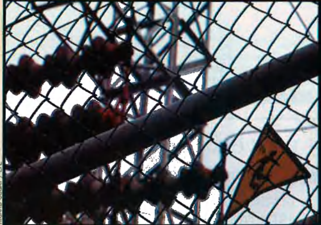
Dalt, turistes que el passat 1 de juliol havien començat les vacances al mateix aeroport de Son Sant Joan. Antich treballa contra rellotge perquè no hi haja un nou caos. Al costat d'aquestes ratlles, estació elèctrica. El sector turístic es veu amenaçat pels talls de llum. El sector elèctric encara pateix grans mancances de competència en el mercat.

i, per tant, no deixarà de fer-ho, però no passarà per l'adreçador d'haver d'acceptar que molts llibres no durin més de dues setmanes a les llibreries.