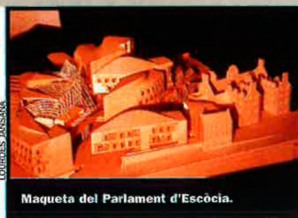
Maqueta del Parlament d'Escòcia.

Continuïtat de l'obra. Els projectes amb què estava treballant Miralles en el moment de morir segueixen enda-