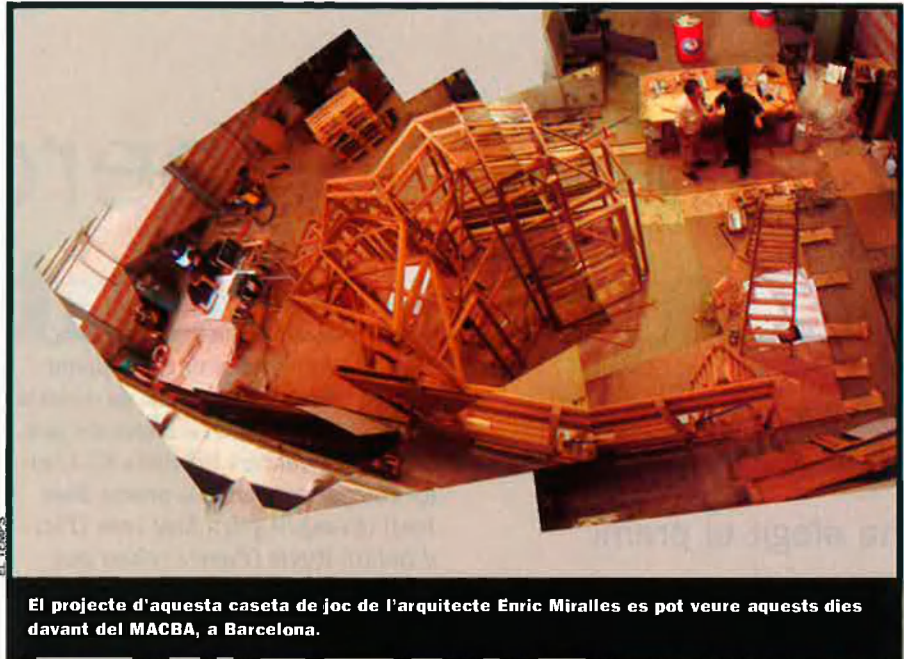
El projecte d'aquesta caseta de joc de l'arquitecte Enric Miralles es pot veure aquests dies davant del MACBA, a Barcelona.