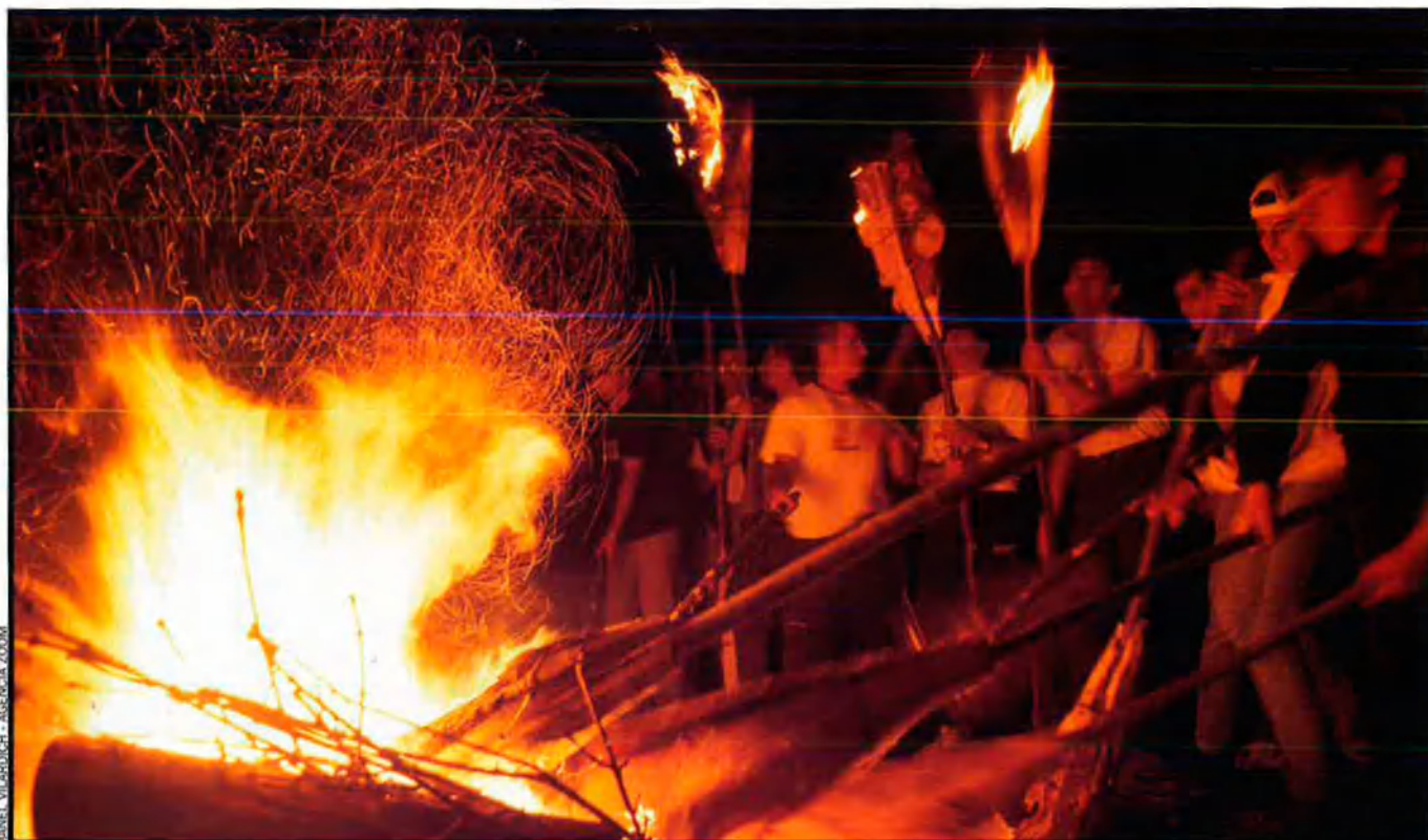
Hores abans de l'encesa de la falla gran a la Plaça Major d'Isil, entre cinquanta i seixanta fallaires han pujat al pujol del Faro. Allà esperen la cremada de la falla, menjant i bevint al voltant d'una foguera.

gran i formen una gran foguera que durarà tota la nit. La festa acaba amb balls al voltant del foc: el ball de bastons, el ball pla i la "Bolanger", iniciada per les dones que conviden els homes a afegir-s'hi. Aquestes danses, així com la música, han estat recentment recuperades i ara tornen a formar part del ritual.