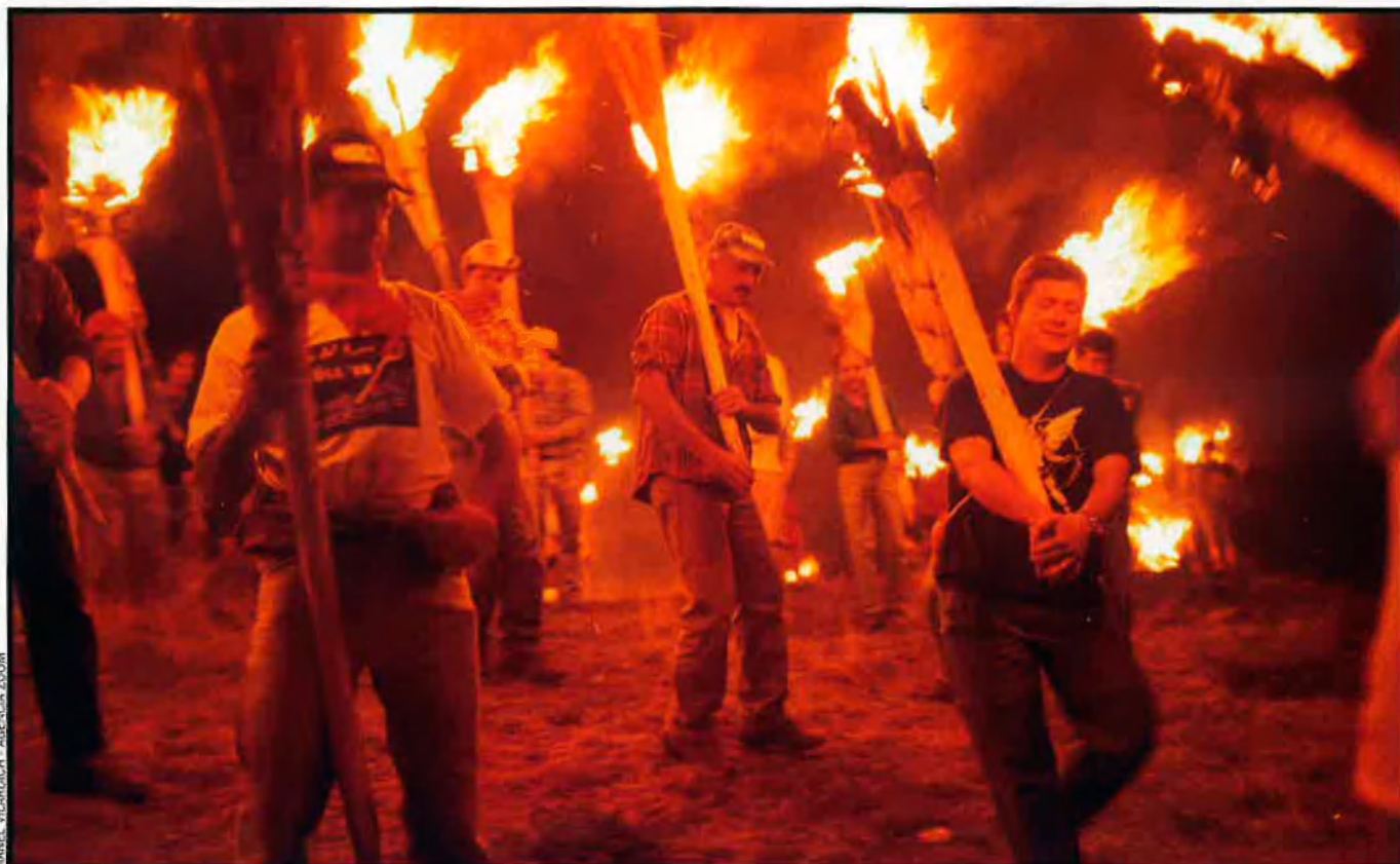
Inici de la baixada de les falles a Taüll. La festa acull centenars de persones a l'Alta Ribagorça. A la vall de Boí diuen que els mals esperits que surten a les nits fugen quan veuen el foc i les fogueres.