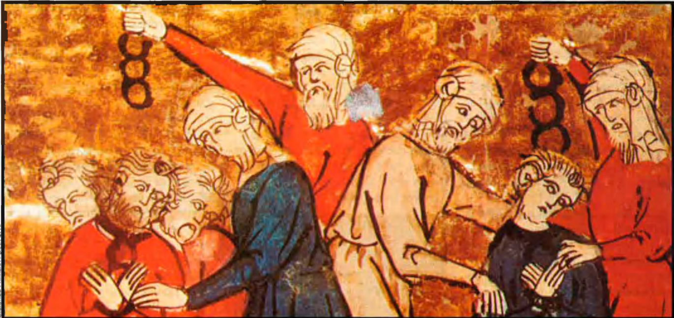
La majoria dels esclaus baixmedievals no eren producte de la guerra, sinó de la pirateria i dels deutes. A la imatge, homes emmanillant uns esclaus. L'Església, tot i demanar que se'ls tractés amb justícia, també en tenia.