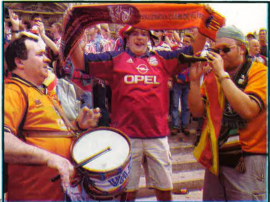
Els aficionats del València i del Bayern van ocupar amb germanor els carrers del centre de Milà. Els bavaresos aplaudien l'esclat dels milers de traques dels de Mestalla.