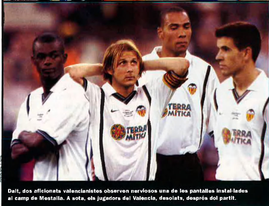
Dalt, dos aficionats valencianistes observen nerviosos una de les pantalles instal·lades al camp de Mestalla. A sota, els jugadors del València, desolats, després del partit.