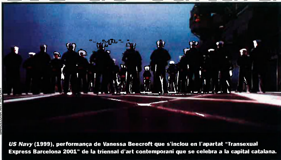
US Navy (1999), performance de Vanessa Beecroft que s'inclou en l'apartat "Transexual Express Barcelona 2001" de la triennial d'art contemporani que se celebra a la capital catalana.

La Triennial de Barcelona i la Biennial de València envairan durant els cinc mesos vinents els museus i els carrers de les dues ciutats amb tot tipus de propostes d'art contemporani. La Triennial intentarà demostrar que la cultura no ha de ser necessàriament pur espectacle, mentre que la Biennial es presenta com el primer punt de trobada de comunicació entre les arts.