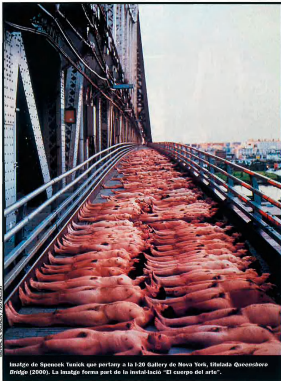
BIENNAL DE VALÈNCIA / I-20 GALLERY