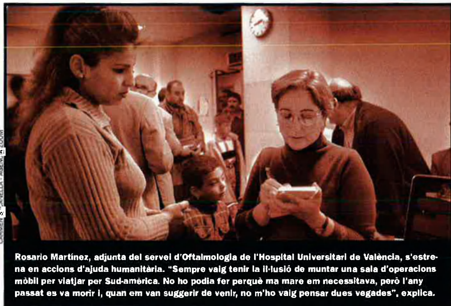
CARMEN S. PANELLA - AGENCIA ZOOM

Aquesta és la crònica del que hi van veure.