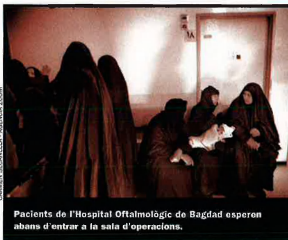
Pacients de l'Hospital Oftalmològic de Bagdad esperen abans d'entrar a la sala d'operacions.

No sempre ha estat així a l'Iraq. Des que el 1968 va arribar al poder, el Partit Baath, de tall socialista i popular, es va proposar aprovar una de les assignatures pendents del país: l'analfabetisme. "La instrucció dels nostres ciutadans és la nostra millor energia", promulgava un dels seus lemes. Durant la dècada dels 80, Saddam Hussein va invertir un 6% del PIB en educació, política que va