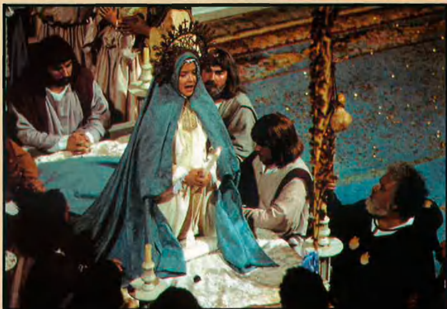
Dalt, imatge del Misteri d'Elx, que ha rebut la distinció d'Obra Mestra del Patrimoni Oral i Immaterial de la Humanitat. A sota, esquerra, Artur Mas, futur candidat a la presidència de la Generalitat de Catalunya. Al costat, cua per a comprar entrades a l'estadi del Valencia CF.