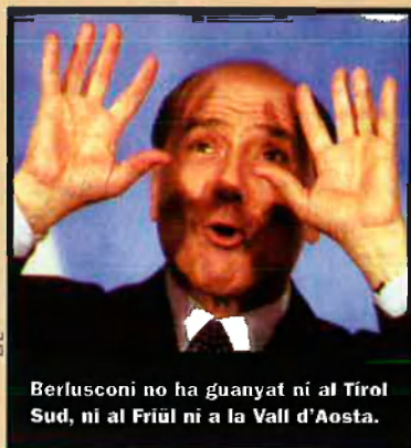
Berlusconi no ha guanyat ni al Tirol Sud, ni al Friül ni a la Vall d'Aosta.

Silvio Berlusconi ha guanyat les eleccions italianes amb comoditat. Però, als territoris de cultures minoritzades, els nacionalistes, la majoria coalitzats amb l'Olivera, han aguantat l'embat de la dreta. A l'Alguer el candidat Francesco Carboni ha aconseguit el 40,7% dels vots, també han guanyat els nacionalistes d'esquerra al Tirol Sud, a Friül i a la Vall d'Aosta.