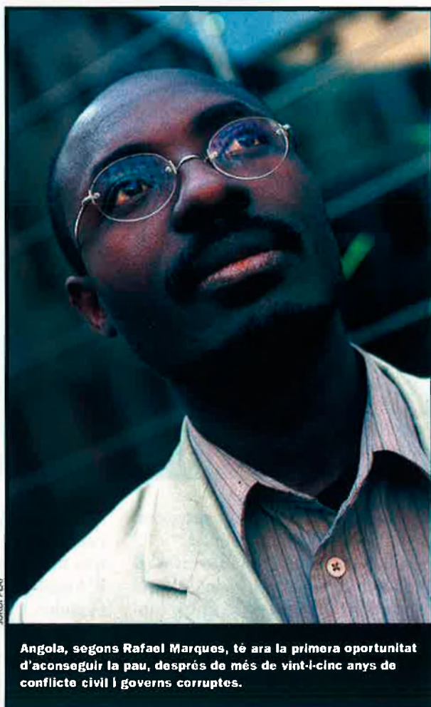
Angola, segons Rafael Marques, té ara la primera oportunitat d'aconseguir la pau, després de més de vint-i-cinc anys de conflicte civil i governs corruptes.

(MPLA), en el poder, ni la Unió Nacional per la Independència Total d'Angola (UNITA), que sempre s'han oposat a aquestes iniciatives, sinó la societat civil, que pensa en una dinàmica sense exclusions de cap mena. Una societat civil més responsable i