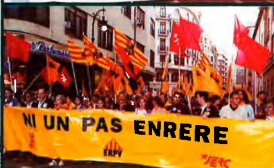
De dalt a baix i d'esquerra a dreta, les pancartes d'Esquerra Unida del País Valencià; Iniciativa per Catalunya-Verds, Els Verds i Iniciativa pel País Valencià; Esquerra Verda; Partit Socialista d'Alliberament Nacional; CC OO del País Valencià, amb el seu secretari general al capdavant, que reclamava el requisit lingüístic com a garantia d'ensenyament valencià; i Esquerra Valenciana, Esquerra Republicana del País Valencià i JERC.