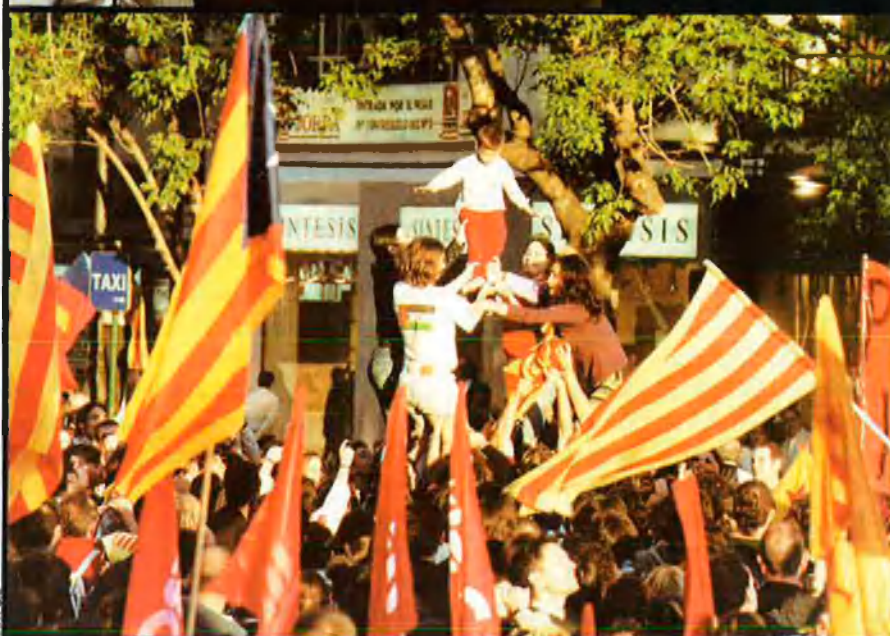
Els castells van ser una constant durant tota la manifestació. Mentre es realitzaven els parlaments, aquest petit anxaneta es va convertir en un símbol de futur.