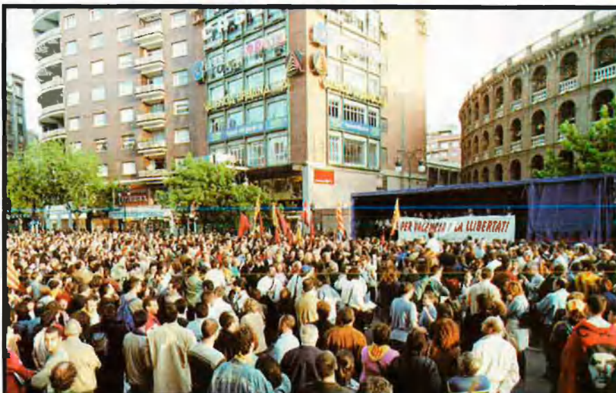
Davant de la plaça de bous, amb l'accés denegat, s'hi va instal·lar un escenari des d'on es van realitzar els parlaments. Quedava ben explícit, així, el rebuig a la prohibició.