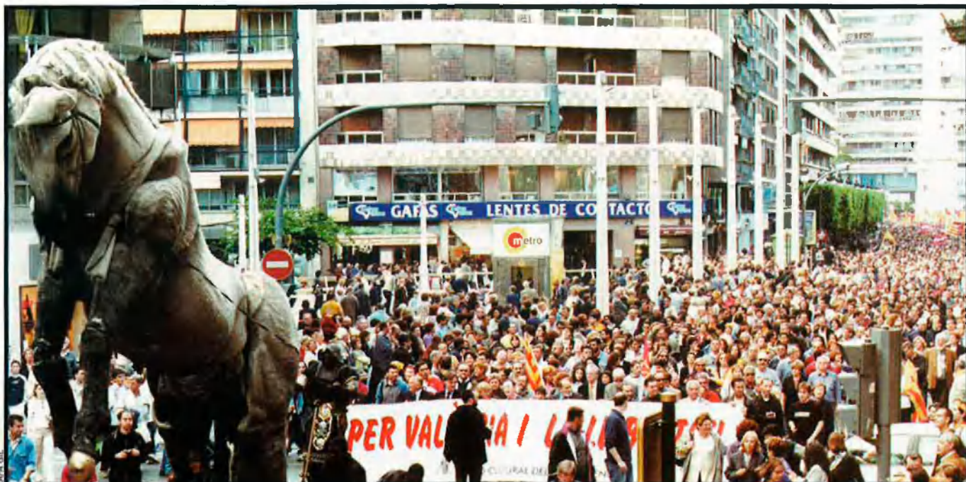
La multitud va omplir els carrers de la ciutat de València. A la imatge, la capçalera de la manifestació, amb la pancarta inicial d'Acció Cultural del País Valencià i el cavall articulad que la precedia, un dels elements que havien de formar part de l'espectacle prohibit.