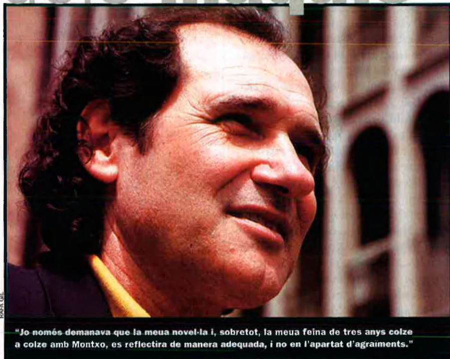
"Jo només demanava que la meua novel·la i, sobretot, la meua feina de tres anys colze a colze amb Montxo, es reflectira de manera adequada, i no en l'apartat d'agraïments."

L'estrena de 'Silencio roto', l'última pel·lícula del director navarrès Montxo Armendáriz, que recorda la lluita dels maquis contra el franquisme, ha estat envoltada de polèmica per les declaracions de l'escriptor valencià Alfons Cervera afirmant que el film utilitza personatges i diàlegs de la seua novel·la 'Maquis' i que, sobretot, en reflecteix l'univers moral. Cervera i Armendàriz expressen en aquestes dues entrevistes la seua opinió al respecte.