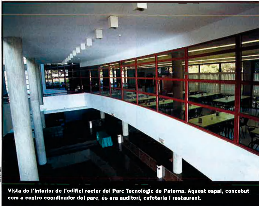
Vista de l'interior de l'edifici rector del Parc Tecnològic de Paterna. Aquest espai, concebut com a centre coordinador del parc, és ara auditori, cafeteria i restaurant.

Una altra és la visió que va expressar Arturo Virosoque, president de la Cambra de Comerç de València, durant la presentació del conveni per a la promoció i el desenvolupament del Parc Tecnològic: "Es parla d'empreses innovadores, però, al cap i a la fi, totes les empreses fem innovació."