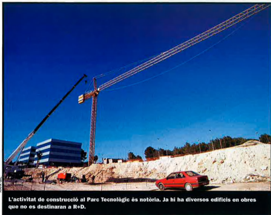
L'activitat de construcció al Parc Tecnològic és notòria. Ja hi ha diversos edificis en obres que no es destinaran a R+D.

Els orígens. El Parc Tecnològic de València va ser pensat com un espai on conviessin els diferents instituts tecnològics sectorials amb empreses de diversos camps que tingueren un component important d'investigació i desenvolupament, i amb el Centre Europeu d'Empreses Innovadores (CEEI), un edifici que serviria com a incubadora