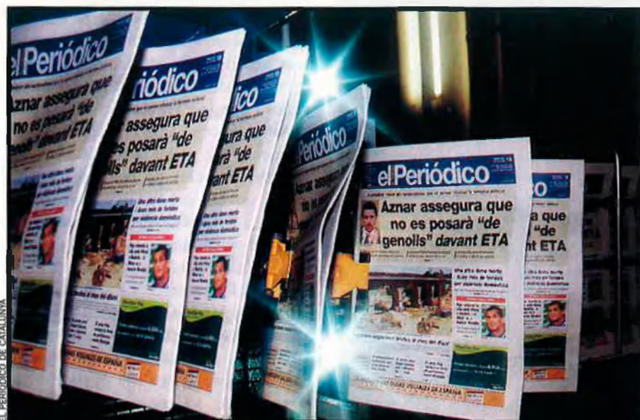
La planta d'impressió de Parets del Vallès ha estat una de les últimes inversions del grup Zeta. Els 15.000 milions que va costar s'han convertit en un llast, segons algunes fonts.

Un dels moments més difícils per a Interviú i el grup que començava a erigir