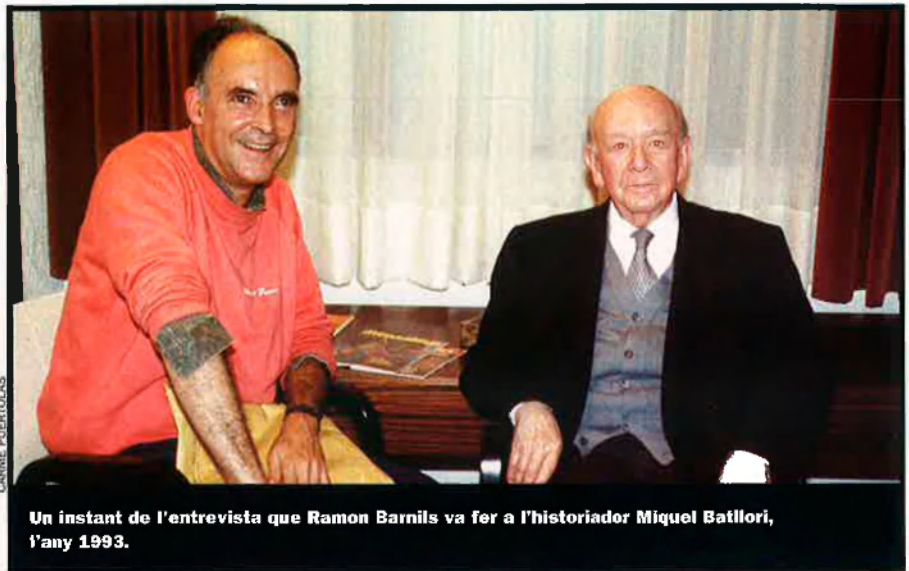
Un instant de l'entrevista que Ramon Barnils va fer a l'historiador Miquel Batllori, l'any 1993.

—Sí, molts, perquè no és una cosa habitual. Hi ha gent que s'empipa o s'estranya. És normal que hi hagi problemes. Però no els busco. Quan algú es queixa del que he escrit... Si reben, reben, però de retruc. Fer un