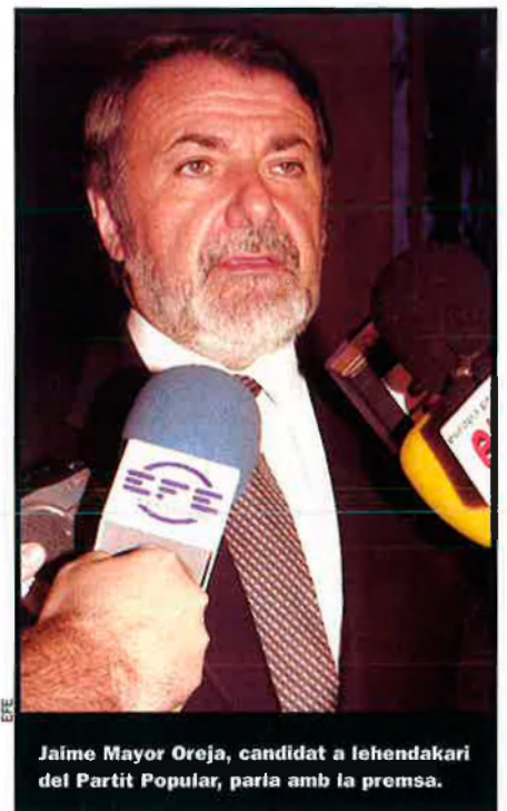
Jaime Mayor Oreja, candidat a lehendakari del Partit Popular, parla amb la premsa.

En el capítol de les esperances, el gran objectiu electoral del PNB és obtenir 500.000 vots i superar, amb escreix, els més de 350.000 que en va sumar l'any 1998. La xifra del mig milió de vots és un desig expressat en veu alta per diri-