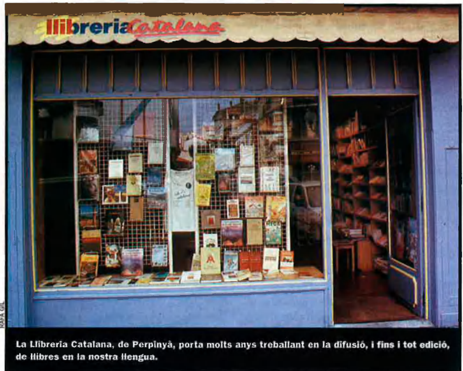
La Llibreria Catalana, de Perpinyà, porta molts anys treballant en la difusió, i fins i tot edició, de llibres en la nostra llengua.

Un nombre important d'editorials d'arreu els Països Catalans canalitzen els seus esforços en l'edició d'estudis d'àmbit local, especialment d'enfocament històric, però també lingüístic, sociològic i, sobretot, relacionats amb la cultura popular i amb el patrimoni arquitectònic o paisagístic. És el cas de les mallorquines Editorial Corts, Documenta Balear i la veterana Editorial Moll, que, tot i publicar tota mena de gèneres literaris, té com a especialitat les obres de didàctica de la llengua i d'història i folklore balear. Recentment també ha