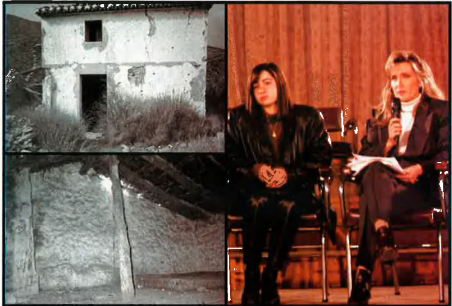
Dalt, a l'esquerra, dues imatges de la caseta de la Romana on es van cometre les tortures. Al costat, un instant del programa de Nieves Herrero que va lligar la tenebra mediàtica al cas. Davall, una escena de l'enterrament de les víctimes (hi assistiren 30.000 persones).

El perquè de la ferida. La força mediàtica d'Alcàsser es nodreix de la sensació d'irresolubilitat definitiva que l'impregna, per causa de la desaparició del principal autor del crim. Però també naix de tot allò que reflecteix el cas. Perquè Alcàsser ha estat el major aparador recent de les grans esclertes del sistema. Esclertes en forma d'errades de la justícia (Anglés va cometre els assassinats fugit d'un permís penitenciari). En forma d'errades policials (la mateixa escapada de l'Asuquiqui). En forma d'errades en la instrucció del sumari. En forma d'errades socials (dos individus del carrer poden matar perquè sí les filles o germanes de qualsevol). Tot plegat conforma un panorama d'horror inacceptable... sobretot perquè es podria repetir. I per això, molts ciutadans, units per connexió