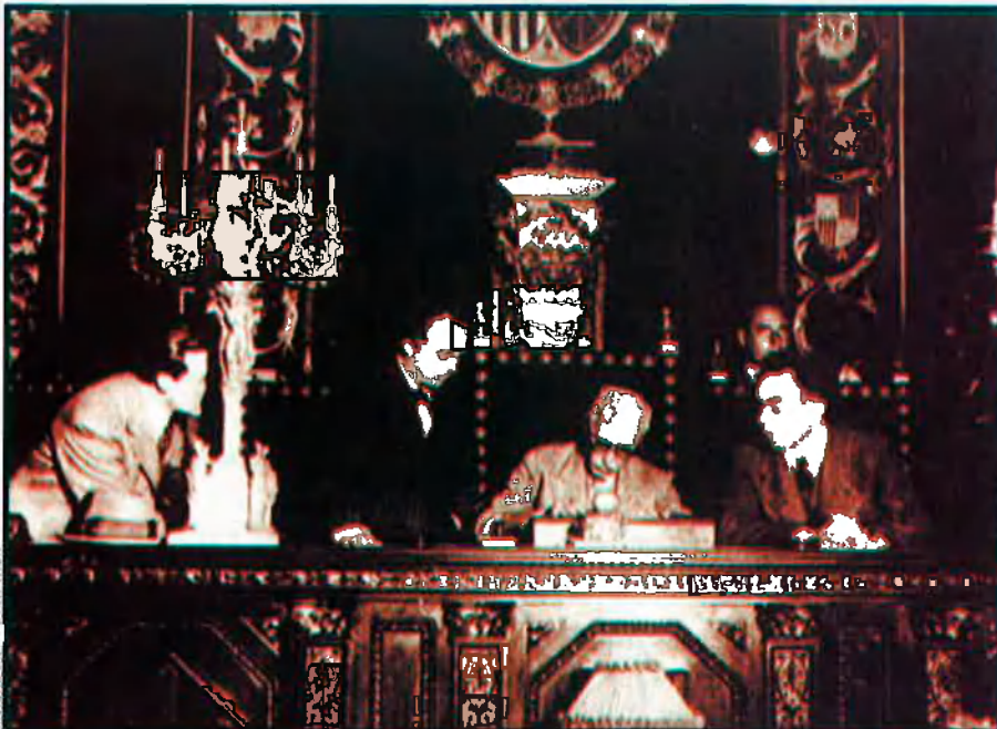
El president Francesc Macià signa la proclamació de la República Catalana, entre Ventura Gassol i Joan Casanovas, el 14 d'abril de 1931. ERC havia guanyat les eleccions amb claredat.

L'audàcia de Lluís Companys i de Francesc Macià en precipitar la transferència del poder després de l'èxit electoral d'ERC, va fer que es proclamés la república a Barcelona cinc hores abans que Madrid i que no fos simplement proclamada la república espanyola sinó la República Catalana dins la "Confederació de pobles ibèrics". No hi havia, però, una voluntat insurreccional efectiva. Tres dies després la República Catalana es convertia, en negociació entre Madrid i Barcelona, en un govern provisional de la Generalitat, amb la immediata absorció de les quatre diputacions provincials catalanes per la nova Generalitat i la promesa d'un estatut d'autonomia a partir del projecte que redactaria una diputació elegida pels ajuntaments catalans i que hauria de ser aprovat en referèndum, com així va ser efectivament el 2 d'agost de 1931. No hi va haver autodeterminació perquè la darrera paraula la tenien les Corts constituents republicanes, on els catalans havien d'estar en minoria i on es va imposar un retall important a les aspiracions catalanes.