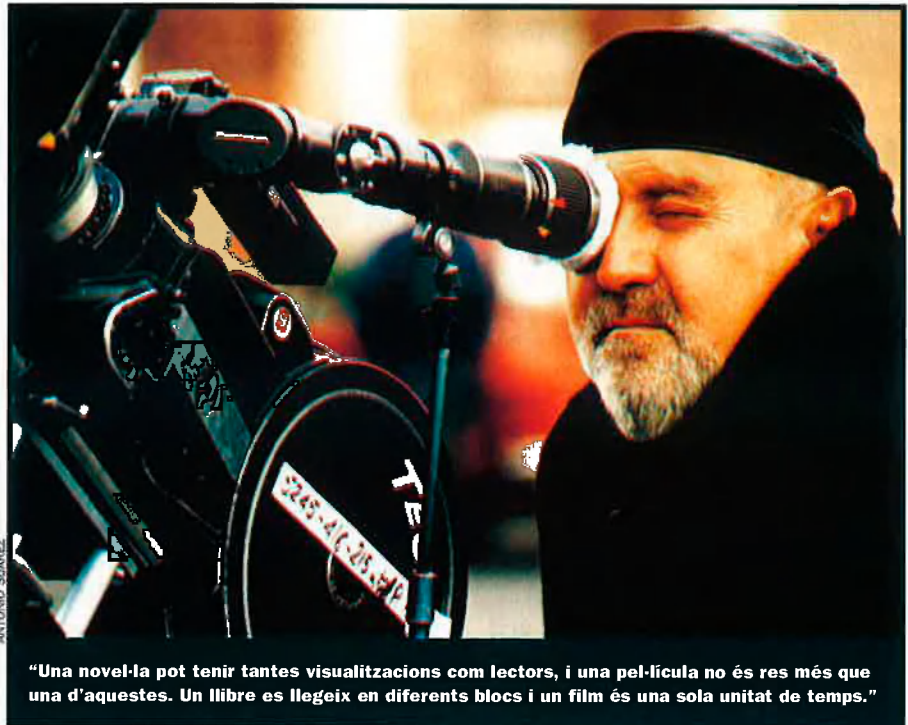
“Una novel·la pot tenir tantes visualitzacions com lectors, i una pel·lícula no és res més que una d'aquestes. Un llibre es llegeix en diferents blocs i un film és una sola unitat de temps.”

—Ens va donar suport moral a base de paelles i poc més. Vicent és dels que entenen que una novel·la pot tenir tantes visualitzacions com lectors i que una pel·lícula no és res més que una d'aquestes. Hi ha escriptors que ho comprenen a la perfecció, d'altres que, tot i que no els agrada, són elegants i no diuen res, i hi ha gent tan desagradable com l'Antonio Gala que, després de cobrar, es permet la mala educació de criticar-ho tot a tot arreu. S'ha de