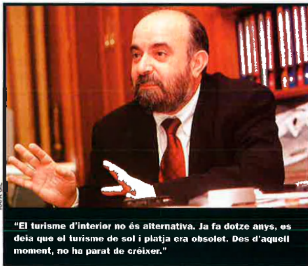
“El turisme d'interior no és alternativa. Ja fa dotze anys, es deia que el turisme de sol i platja era obsolet. Des d'aquell moment, no ha parat de créixer.”

—Els pobles tenen dret a evolucionar i a obtenir un nivell d'ingressos que els permeta portar el nivell de vida que hui es considera estàndard. En vista d'un manteniment paisatgístic, no es pot condemnar un poble a no tenir desenvolupament. O se'ls donen altres solucions o les persones hauran de viure. I si per viure, han d'edificar,