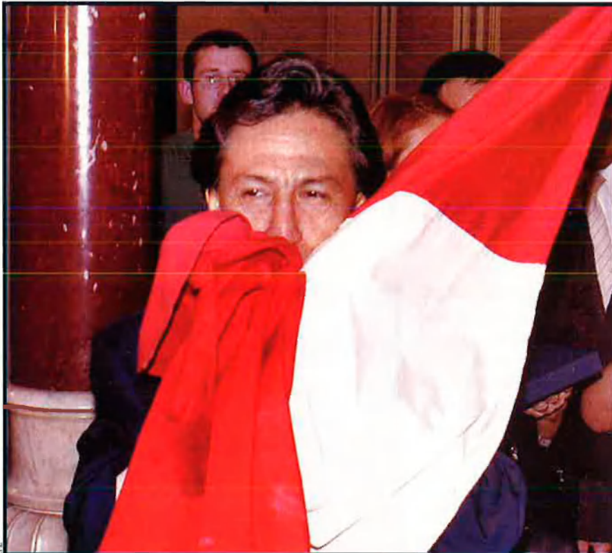
Alejandro Toledo és el candidat més ben situat. Ha hagut de lluitar molt contra la premsa sensacionalista, que ha publicat nombroses calúmnies sobre el candidat de Perú Possible.