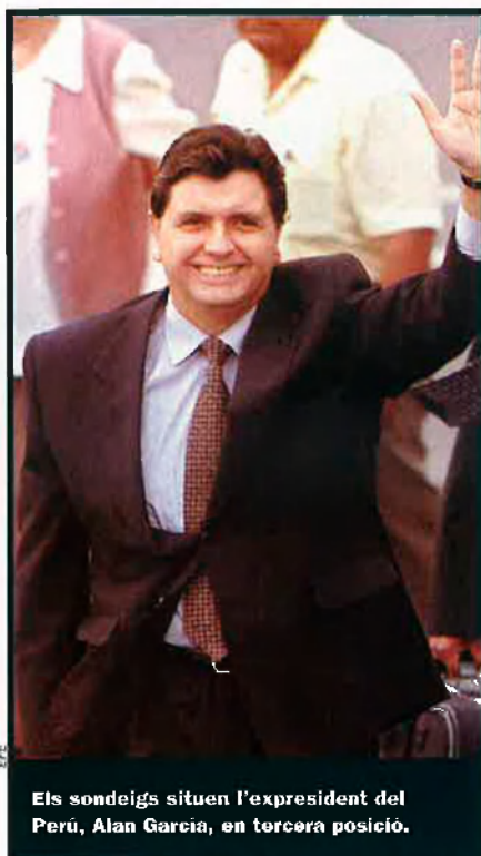
Els sondeigs situen l'expresident del Perú, Alan García, en tercera posició.

Les declaracions socials xocaven als analistes, que recorden que durant els