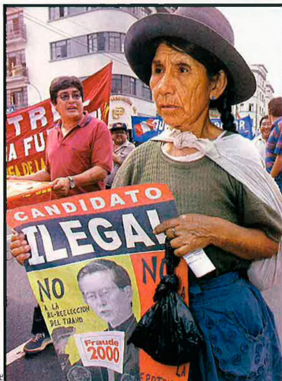
Manifestació a Lima contra Fujimori el passat 23 de març del 2000, poc abans de celebrar-se les darreres eleccions presidencials peruanes.

Les fotos i el cas de la suposada filla fora del matrimoni, que també ocupa espais importants a la premsa i televisió, recorden la campanya de fa un any, quan Toledo amenaçava el president