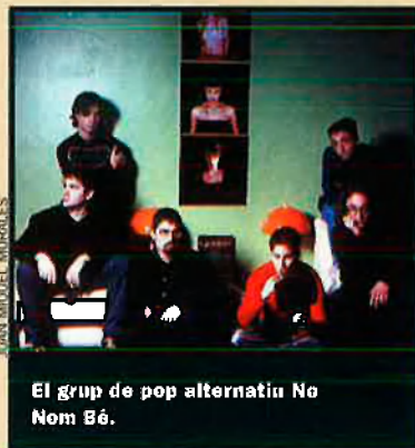
El grup de pop alternatiu No Nem Bé.

El grup de pop alternatiu No Nem Bé va ser distingit el 23 de març amb el premi a la millor cançó en català en la cinquena edició dels Premios de la Música de la SGAE. El senzill "Idiota", que forma part del seu primer disc, Unisex , ha estat la cançó guardonada; un tema definit per la formació com "aparentment fàcil, però que amaga una crítica als prejudicis establerts".