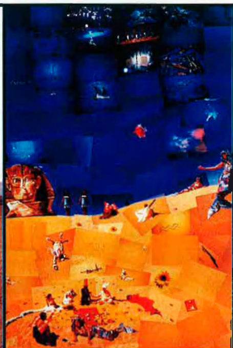
A l'esquerra, Desert de Califòrnia (hivern-primavera del 2000), de William Eggleston. A la dreta, La mare del món, desert de Líbia i el cim del Sinai (març del 2000), collage de Lara Baladi fet a força de fotografies.

siger gràcies també a la seva obra escrita, que constitueix un cim de la literatura de viatges: Sorres d'Àrabia i Els àrabs dels aiguamolls .