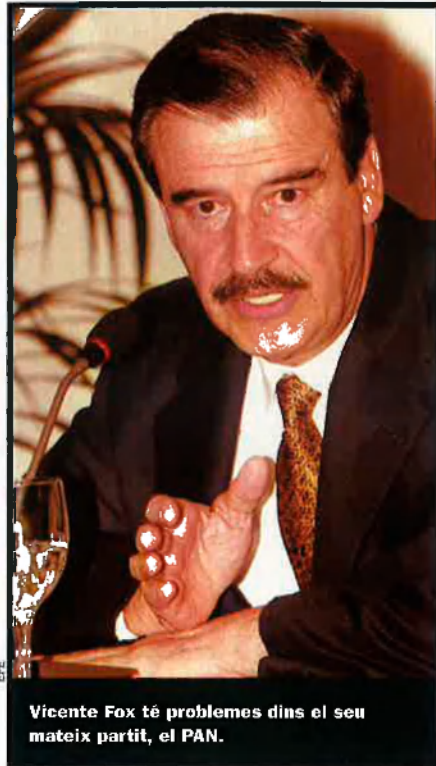
Vicente Fox té problemes dins el seu mateix partit, el PAN.

A Nurío, més de 3.000 delegats, a més de la societat civil nacional i internacional, van llançar un crit unitari i consensuat: el compliment dels Acords de San Andrés. Uns compromisos que, si es concretessin en la legislació mexicana, trencarien els falsos miratges occidentilitzats que pretén implantar l'elit gover-