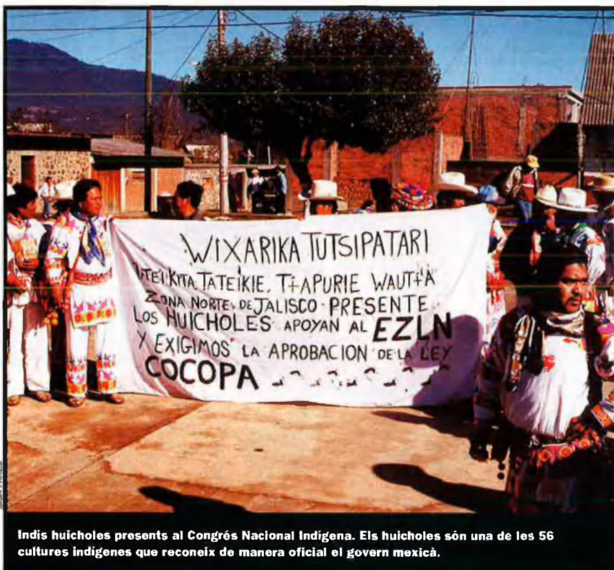
Indis huicholes presents al Congrés Nacional Indígena. Els huicholes són una de les 56 cultures indígenes que reconeix de manera oficial el govern mexicà.

destaca el Conveni 169 de l'Organització Internacional del Treball (OIT). "Aquest tractat internacional és un document històric, perquè per primera vegada un conveni internacional reconeix les cultures indígenes com a pobles, terme que implica el dret a la sobirania dins dels propis territoris", destaca Patricio Cardoso, expert en Drets Humans i docent de la Universidad Autónoma Nacional de México (UNAM).