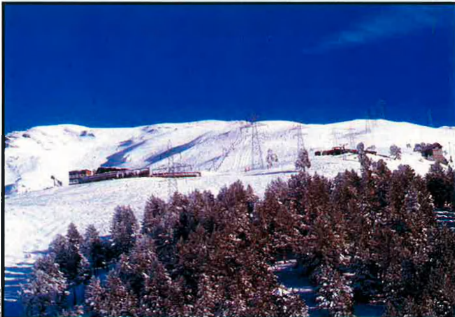
El grup Baquéira Beret, propietari de l'estació d'esquí més important del Pirineu, és controlat en un 49,4% per l'asseguradora Catalana Occidente, de la família Serra.