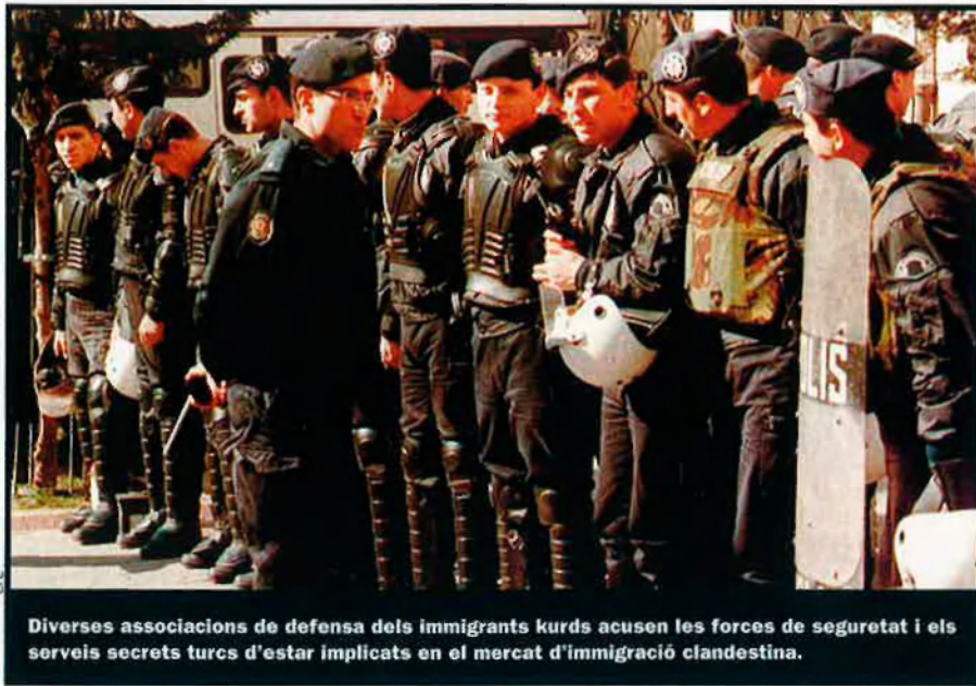
Diverses associacions de defensa dels immigrants kurds acusen les forces de seguretat i els serveis secrets turcs d'estar implicats en el mercat d'immigració clandestina.

Conscient d'aquest repte, el primer ministre francès, Lionel Jospin, va defensar una setmana després que l'East Sea s'encallés a les costes franceses la necessitat de convocar una conferència conjunta entre la UE i els EUA per mirar de trobar una solució a la qüestió kurda. Una proposta, però, que només ha rebut el suport del govern italià. Malgrat que el "problema kurde" esdevé cada cop més clarament un "problema europeu", la manca d'orientació comuna de la UE en aquest terreny descarta qualsevol iniciativa en aquest sentit. Mentrestant, l'èxode representa la darrera esperança pels kurds.