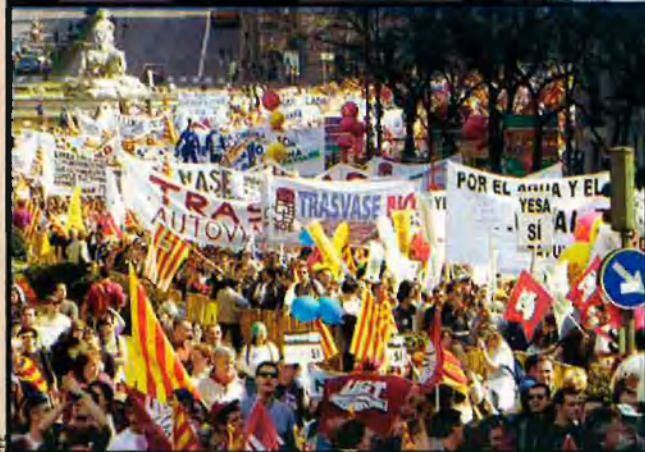
Dalt, els estudiants que es van manifestar contra la presència del rei a la Pompeu Fabra van ser envoltats per la policia. Al costat d'aquestes ratlles, manifestació contra el Pla Hidrològic a Madrid el passat dia 11. Una quiosquera madrilenya va assegurar que havia vist més gent que a la més multitudinària de les manifestacions contra el terrorisme.